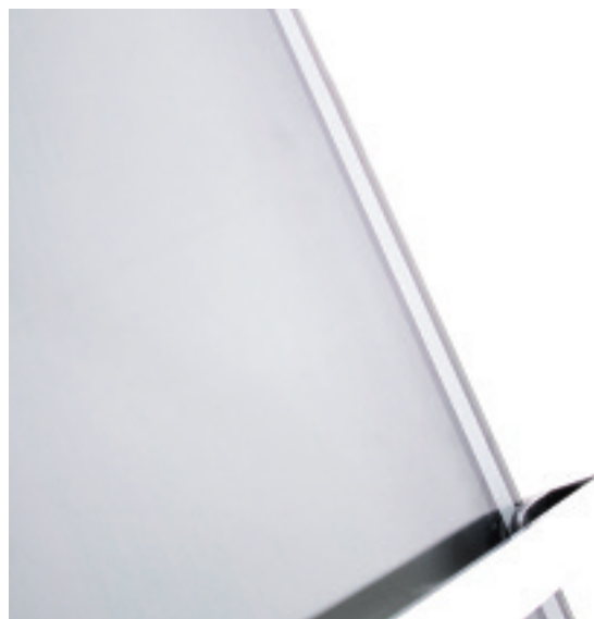
Particolare del radiatore EGO

Radiatore elettrico in vetro che coniuga la cultura del benessere con un intervento progettuale di linea essenziale. Il vetro, materia trasparente, propone calore e nuovo valore ad Ego. L'essenzialità della geometria si abbina ad un gusto estetico che qualifica l'ambiente.