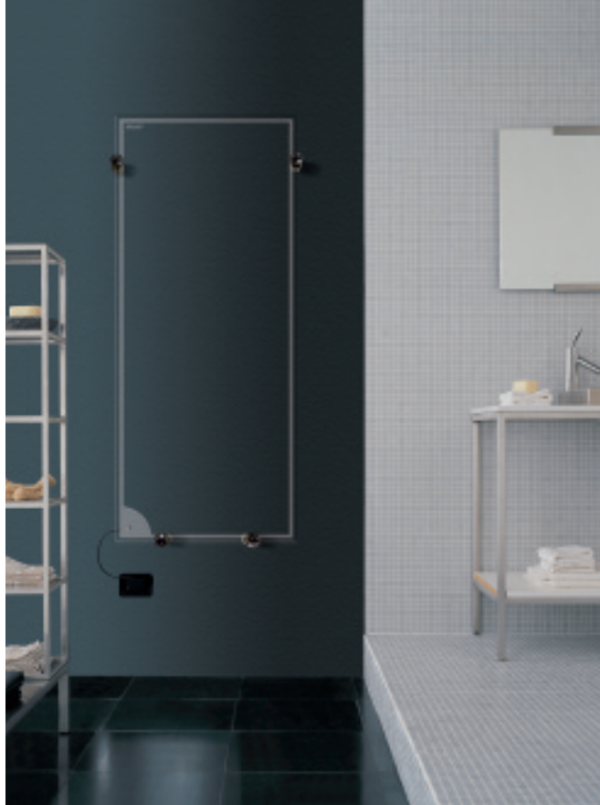
In foto: Radiatore Ego Elettrico. Altezza mm 1400, larghezza mm 600.